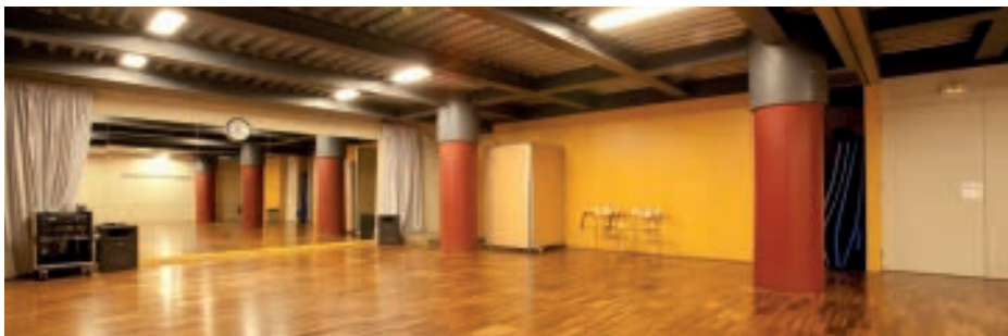
Centre Cívic Cotxeres Borrel, Barcelona

en dichas escuelas. Estas disposiciones servirían de marco de referencia para incluir el teatro mientras se va efectuando el procedimiento del INCUAL, que dura seis años. A la espera de que se cumpla dicho procedimiento se puede utilizar el recurso de habilitación.