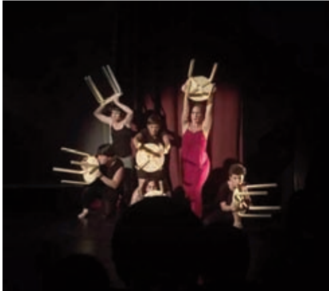
Geu gutaz P6an